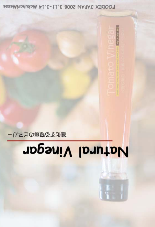
進化する奇跡のビネガー

FOODEX JAPAN 2008 3.11-3.14 MakuhariMesse