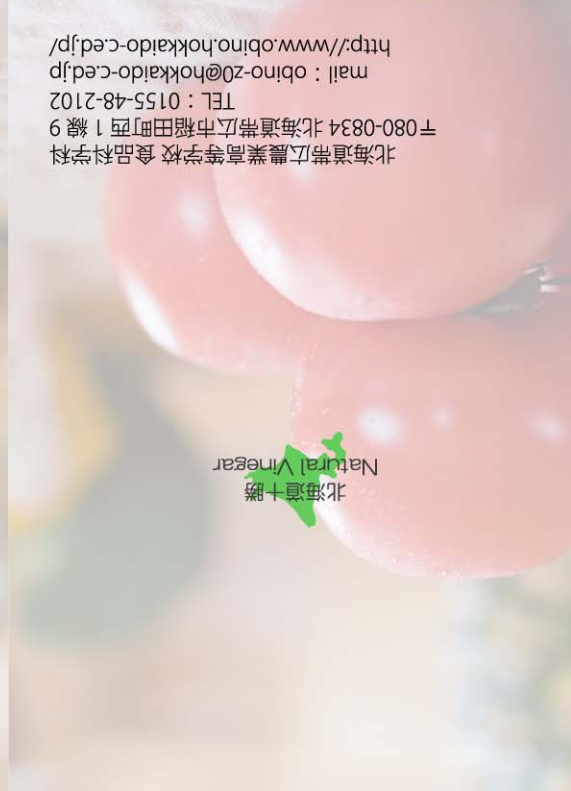
北海道十勝 Natural Vinegar

北海道帯広農業高等学校 食品科学科 〒080-0834 北海道帯広市稲田町西1線9 TEL : 0155-48-2102 mail : obino-z0@hokkaido-c.ed.jp http://www.obino.hokkaido-c.ed.jp/