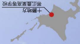
十勝地方 帯広農業高等学校

北海道十勝平野、そこは美食の大地・北海道が誇る大農業地帯。「とちか帯広空港」から車で約30分北上すると、そこには農業研究の情熱が息づくキャンパスが広がる。帯広農業高校。北海道に数ある農業系高校の中でも特に優れた研究施設を有し、700名を超える若者が明日の農業に将来の夢をかけている。